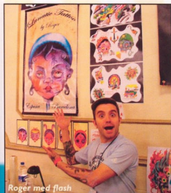
Roger med flash

Förutom mässan, så kollade vi även in tattoo scenen i stan, och där hittade vi en liten turistsoas som kallades "Bond Street". En hel galleria med alternativbutiker, accessoarer,