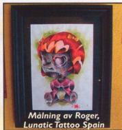
Målning av Roger, Lunatic Tattoo Spain

Ha fett med deg i fickan (Lämna skryt bunten i safetyboxen)